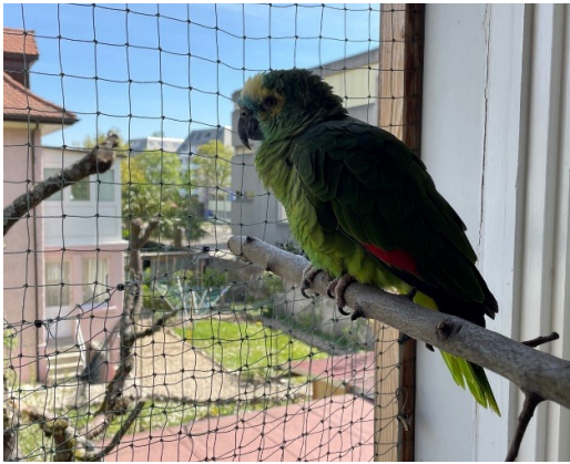
Yellow mit Panorama-Fenster 😊

Yello lebte sich sofort ein und hat unser Büro in Beschlag genommen 😊 Die Blaustirnamazone war sehr zutraulich und machte es sich bequem auf meiner Schulter, während ich arbeitete.